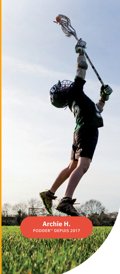
Archie H. PODDER™ DEPUIS 2017